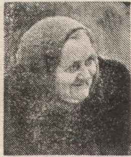
Вышла за калитку бабушка, на дороге смотрит. Кого-то ждёт.

И. ЧУПРЫНИНА. Казахская ССР. (Наш корреспондент).